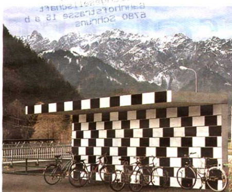
Überzeugte die Juroren: Der „Kunst am Bau“-Wettbewerb der Montafonerbahn.