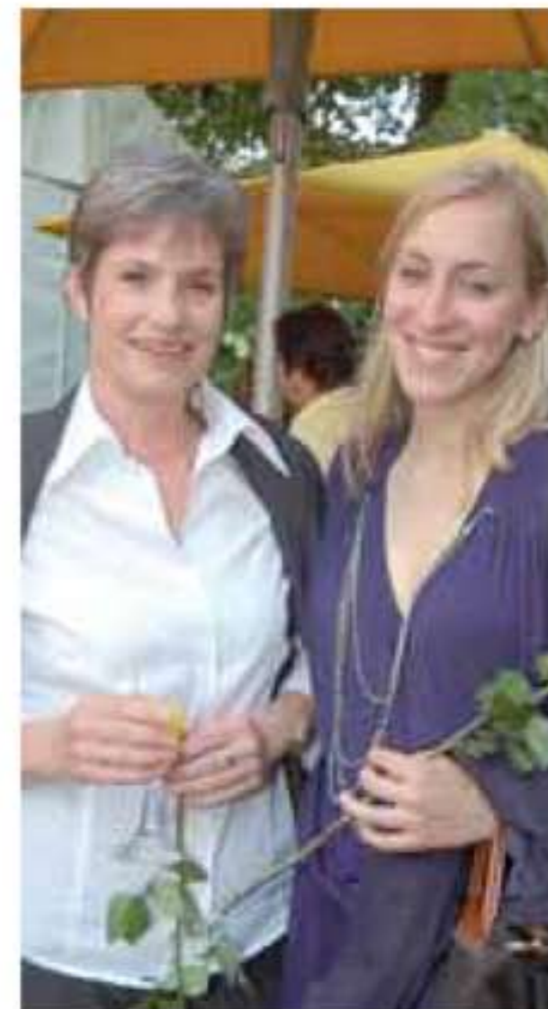
Für alle Damen gab es gelbe Rosen zur Begrüßung.