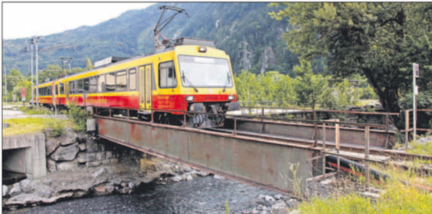
Das MBS-Gleisprojekt im Streckenabschnitt Lorüns sieht auch neue Brückenbauwerke vor.

Im Oktober ergeht das Freizeichen für das „Ill-Alfenz“-Konzept in Lorüns, rund neun Millionen Euro steckt die MBS in das umfassende Um- und Ausbauprojekt. „Auf einer Streckenlänge von knapp einem Kilometer wird ein Trassenneubau erfolgen. Außerdem wird die Erneuerung