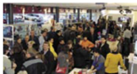
Viele Besucher bei Red Zac Montafon.