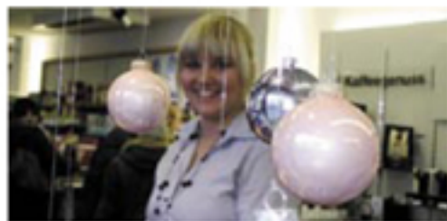
Stilvolles Ambiente beim Red Zac-Advent.