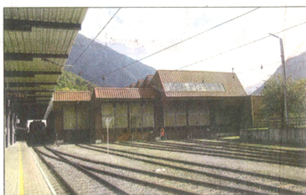
Im Zukunftskonzept macht auch die Remise den Platz frei, das ergibt fürs Schrunser Zentrum neue Bau-Perspektiven.

„Wenn man die Diskussion über Mobilität im Montafon seriös angehen will, gilt es auch, genaue Überlegungen über einen Ausbau der Bahninfrastruktur bis zur Valiseraabahn-Talstation in St. Gallenkirch anzustellen“, bekräftigt MBS-Direktor Bertram Luger. Vorleistungen dazu strebt die Montafonerbahn vorab schon einmal durch ein Projektkonzept zur vorherrschenden